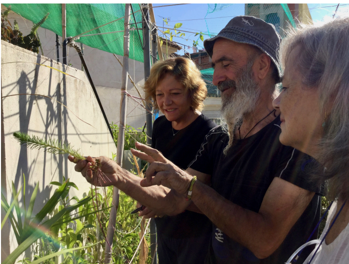
(momentos de actividades en el huerto)

Hoy, la azotea del Centro es el lugar de aprendizaje, encuentro y intercambios intergeneracionales inspirados por el mundo vegetal; es el lugar en el que podemos entender que las palabras “cultura” y “cultivo” tienen la misma raíz.