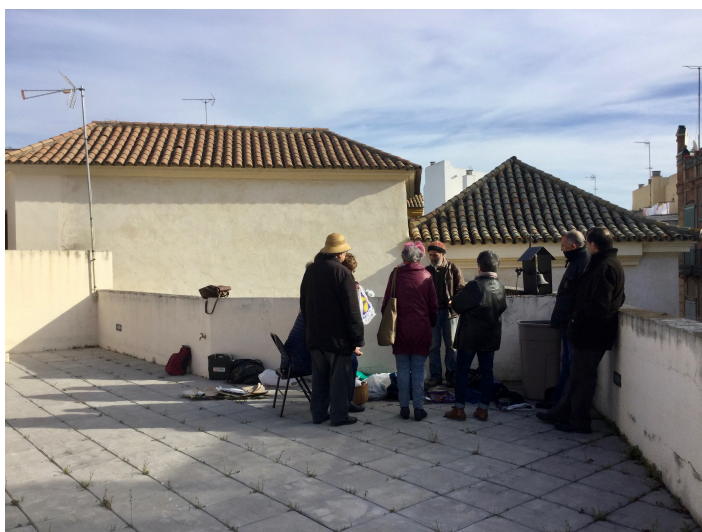
(comienzo del taller de huerto)

Las plantas nos proporcionan oxígeno, alimentos, remedios naturales y bienestar psíquico. También permiten lograr grandes ahorros energéticos en materia de bioclimatización del edificio y reducir el efecto “isla de calor” en la ciudad.